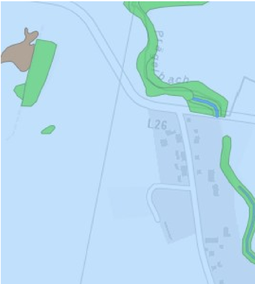
Übersichtskarte der gesetzlich geschützten Biotope gemäß Umweltkarten Portal des LUNG MV, © BKG 2023

Der Geltungsbereich ist im Norden und Westen umgeben von landwirtschaftlich intensiv genutzten Flächen. Im Süden schließt die weitere Bebauung des Ortes an. Gen Osten ist der Ort durch den Prängelbach begrenzt. Dieser ist der Kern des FFH-Gebietes (Schutzgebiet gemäß Flora-Fauna-Habitat-Richtlinie) DE 2048-302 „Ostvorpommersche Waldlandschaft mit Brebowbach“. Sonstige Schutzgebiete nach internationalen Schutzkategorien, wie europäische Vogelschutzgebiete sind nicht vorhanden. Auf nationaler Ebene werden ebenfalls keine Schutzkategorien wie Flächen eines Nationalparks, Naturschutzgebietes, Landschaftsschutzgebietes, Naturparks oder Biosphärenreservats beeinträchtigt.