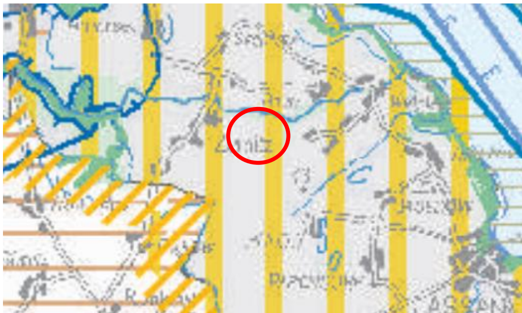
Abbildung 1: Ausschnitt aus dem LEP M-V 2016 (Planungsraum rot markiert)

Gemäß 5.3.(9) des LEP MV sollen Freiflächenphotovoltaikanlagen effizient und flächensparend errichtet werden. Im zweiten Absatz wird das Ziel