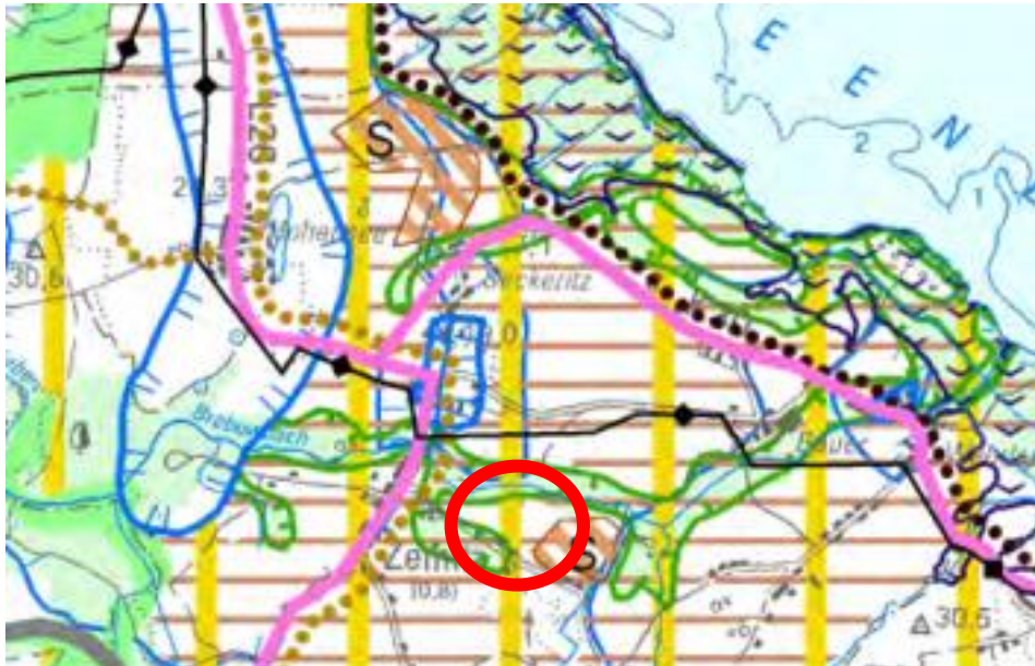
Abbildung 2: Ausschnitt aus dem RREP VP 2010 (Planungsraum rot markiert)

Hinsichtlich der Solarenergie sind in der Planungsregion Vorpommern zudem die textlichen Vorgaben des RREP VP zu beachten. Grundsätzlich ergibt sich auch aus dem RREP VP ein klares Bekenntnis zum weiteren Ausbau der Erneuerbaren Energien. Es wird ausgeführt, dass an geeigneten Standorten die Voraussetzungen für den weiteren Ausbau regenerativer Energieträger [...] geschaffen werden sollen ( RREP VP Programmsatz 6.5.(6) ).