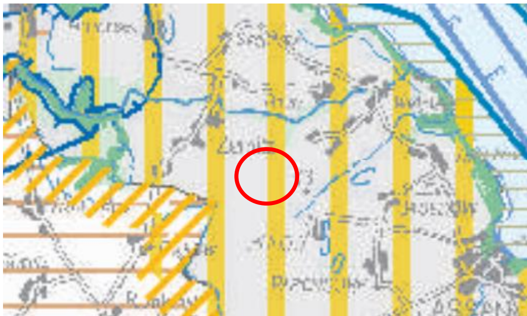
Abbildung 1: Ausschnitt aus dem LEP M-V 2016 (Planungsraum rot markiert)

Gemäß 5.3.(9) des LEP MV sollen Freiflächenphotovoltaikanlagen effizient und flächensparend errichtet werden. Im zweiten Absatz wird das Ziel