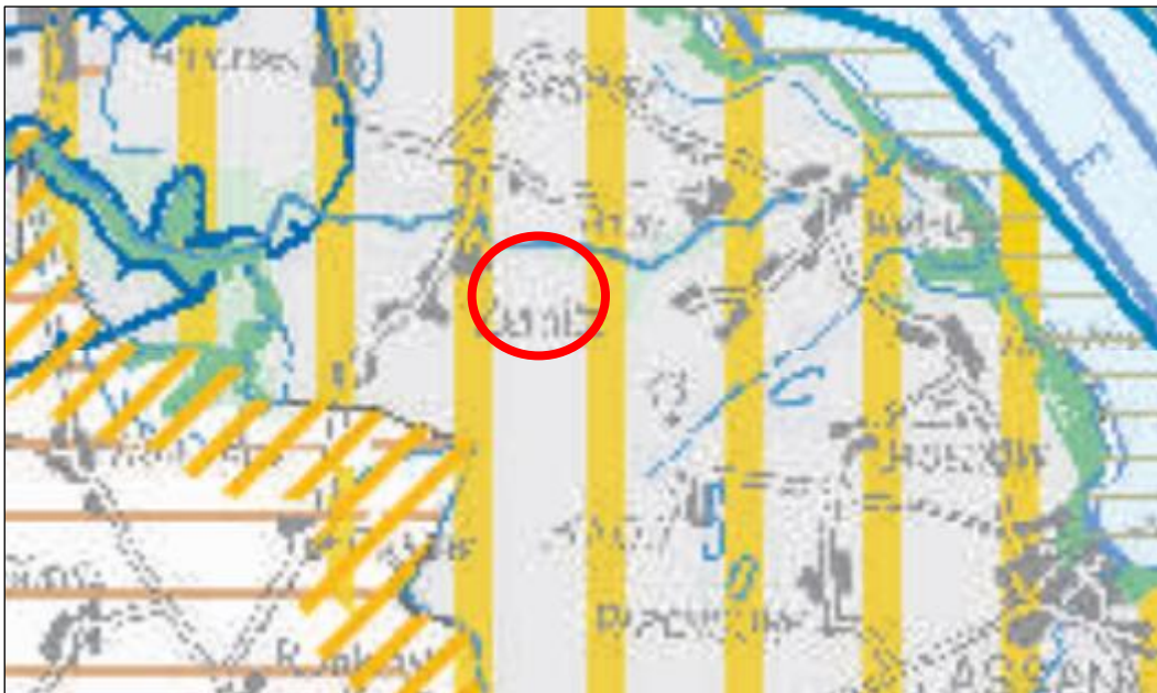
Abbildung 1: Ausschnitt aus dem LEP M-V 2016 (Planungsraum rot markiert)

Gemäß 5.3.(9) des LEP MV sollen Freiflächenphotovoltaikanlagen effizient und flächensparend errichtet werden. Im zweiten Absatz wird das Ziel genannt, nur einen maximal 110 m breiten Streifen landwirtschaftlich genutzter Flächen beiderseits von Autobahnen, Bundesstraßen und Schienenwegen für Freiflächenphotovoltaikanlagen zu nutzen. Der Zielsetzung des LEP wird in der vorliegenden Planung entsprochen, da die landwirtschaftliche Nutzung