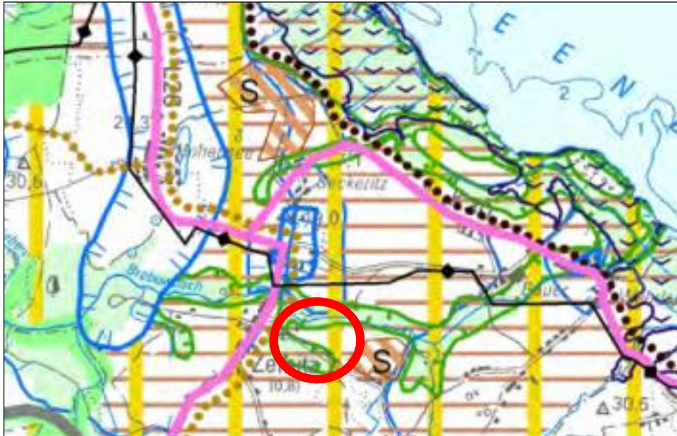
Abbildung 2: Ausschnitt aus dem RREP VP 2010 (Planungsraum rot markiert)

Hinsichtlich der Solarenergie sind in der Planungsregion Vorpommern zudem die textlichen Vorgaben des RREP VP zu beachten. Grundsätzlich ergibt sich auch aus dem RREP VP ein klares Bekenntnis zum weiteren Ausbau der Erneuerbaren Energien. Es wird ausgeführt, dass an geeigneten Standorten die Voraussetzungen für den weiteren Ausbau regenerativer Energieträger [...] geschaffen werden sollen ( RREP VP Programmsatz 6.5.(6) ).