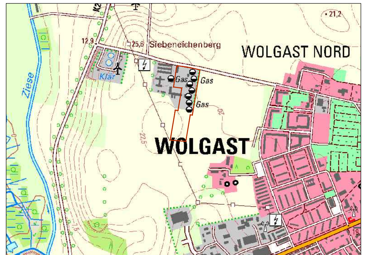
Übersichtsplan/ Topografische Karte