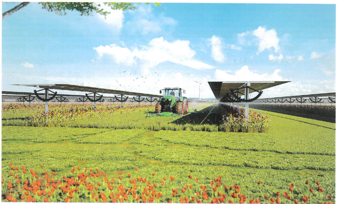
Prinzip-Darstellung: Agri-PV mit einachsigen Trackern auf Grünland