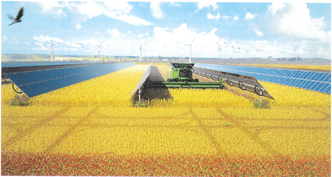
Prinzip-Darstellung: Agri-PV mit einachsigen Trackern auf Ackerland