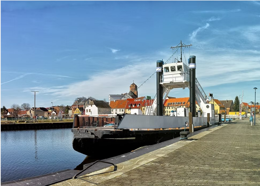
Außenansicht der "STRALSUND" im Stadthafen Wolgast